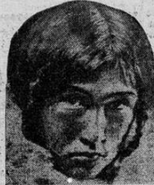
Esta joven esquimal de 24 años, fue elegida reina de las belleras esquimales de entre 24 concursantes. La coronación de "Miss Enooiak (Estrella Brillante) fue celebrada con grandes fiestas. El original de esta fotografía fue traído en trineo tirado por perros a través de 500 millas de hielo