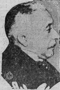
Alcalá Zamora, ex-ministro del gabinete español es mencionado el probable presidente en caso de que la república triunfe en España. Zamora ha estado preso debido a sus ideas republicanas