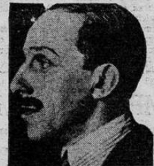
La censura impuesta a todas las comunicaciones en España se considera una indicación de que la revolución sigue progresando a pesar de los anuncios del gobierno en el sentido de que el movimiento ha sido sofocado.