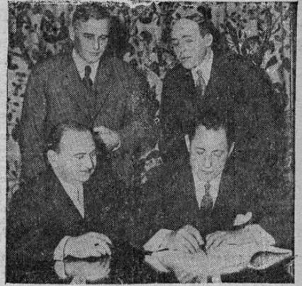
William S. Paley, Presidente del Sistema Columbia de Broadcasting, es ahora el Rey de los Conciertos en los Estados Unidos, como resultado de la fusión de las siete más grandes roganizaciones de concierto del país. Paley aparece a la derecha firmando el contrato correspondiente