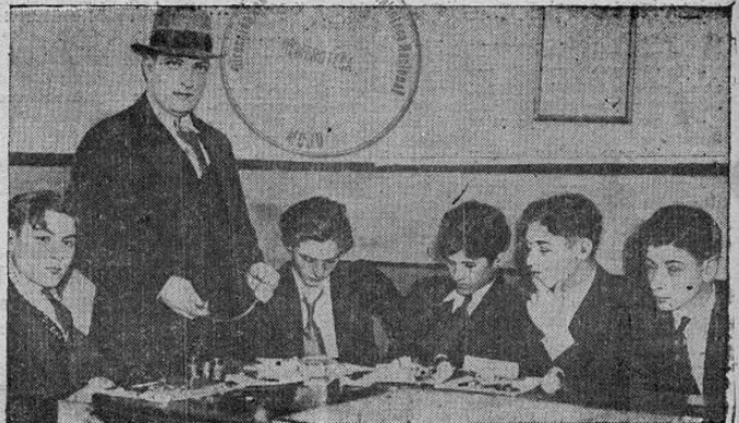
Estos cinco muchacho, de 16 a 18 años de edad, con el detective John Low y las joyas estimadas en varios miles de dólares que se dice fueron robadas por los muchachos en una serie de 50 raterías. Los robos se dice que han tenido lugar en Brooklyn durante los últimos tres meses.